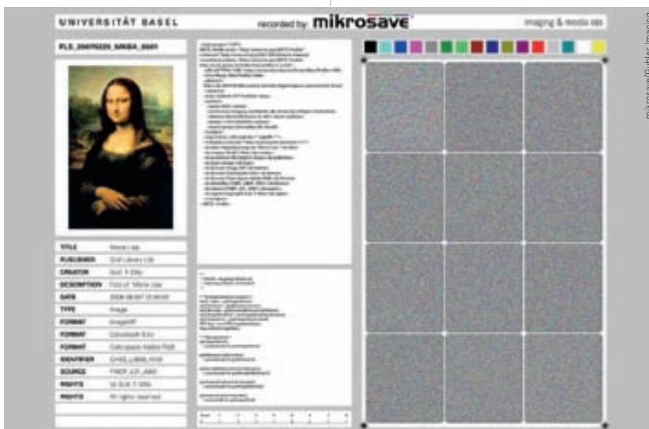
Forscher der Universität Basel digitalisieren das Gemälde der Mona Lisa und speichern es als Punktmuster auf Mikrofilm.