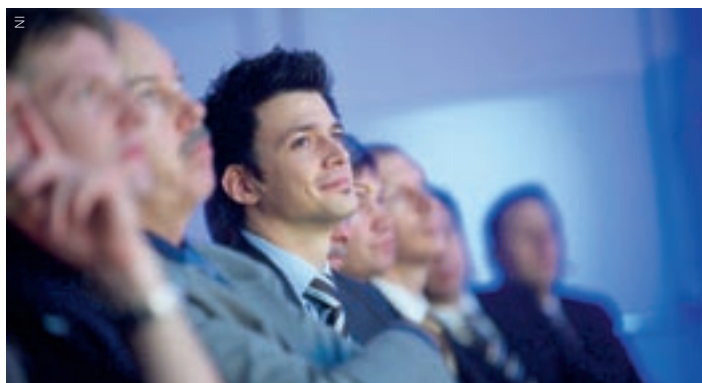
Auch dieses Jahr werden wieder über 350 Entscheidungsträger, Ingenieure und Wissenschaftler an den NIDays erwartet.

«Neues wagen!» – so lautet das Motto des diesjährigen Technologie- und Expertenkongresses NIDays von National Instruments am 2. März in Zürich. Auch 2010 soll der Kongress als Forum dienen, um Impulse zu erhalten, technologische Trends aufzuspüren und Kontakte zu knüpfen.